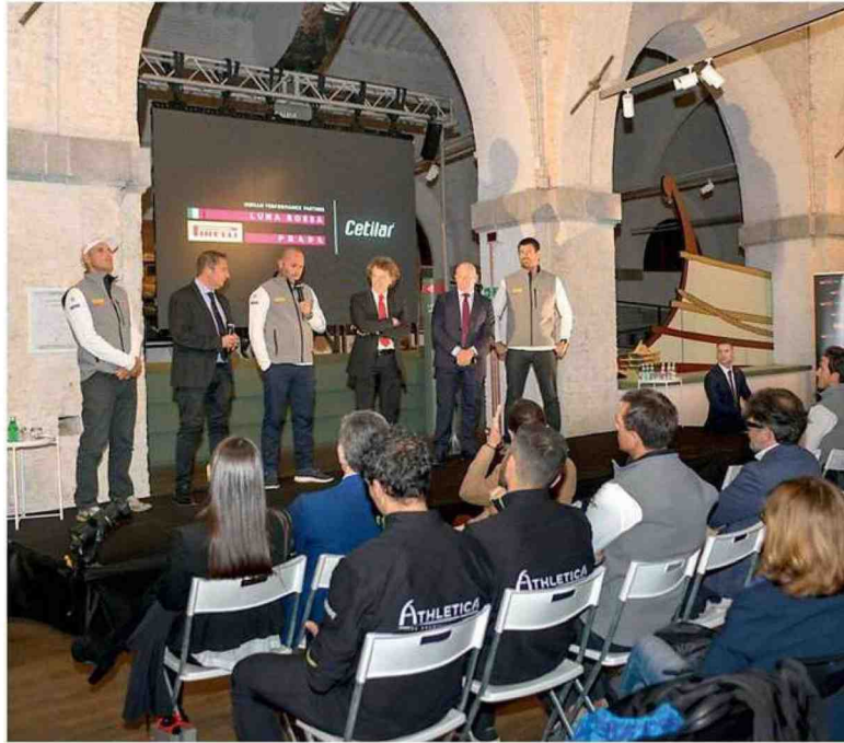
Un momento della presentazione della prestigiosa partnership